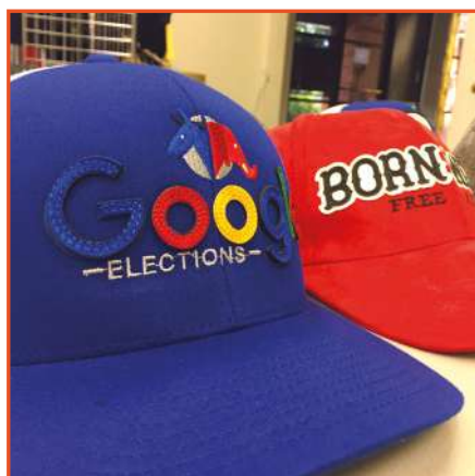
Decorazioni di cappelli Caps decoration

The one and only continuous movement system for embroidery