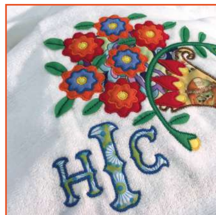
Tessile casa Home textile