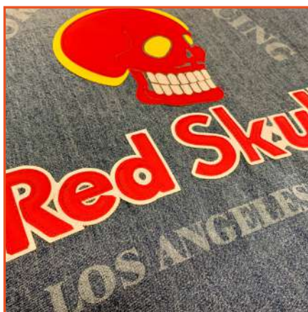
Applique multi strato Multi Layer Appliquè